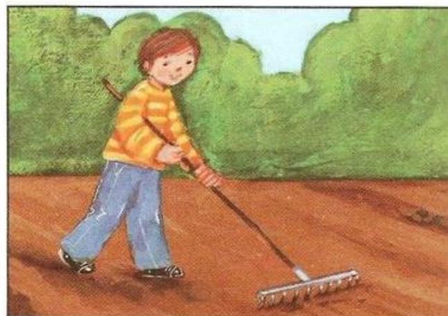
Mateusz grabi ziemię.