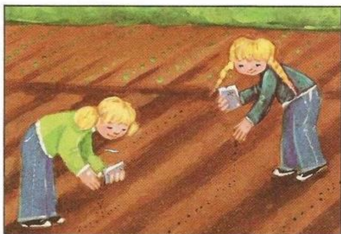
Kamila sieje sałatę. Ula sieje rzodkiewkę.